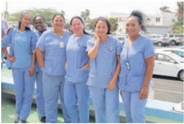
Apertura di siman di enfermeria